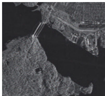
Parte de imagen TerraSAR-X de alta resolución, adquisición en Modo SpotLight (1m de resolución) de Vancouver, Canadá

La cartera de servicios de información geográfica de Infoterra incluye mapas, inventarios y servicios de vigilancia, soluciones que responden a las necesidades y requisitos individuales a nivel local, regional y nacional; además de servicios de capacitación y consultoría.