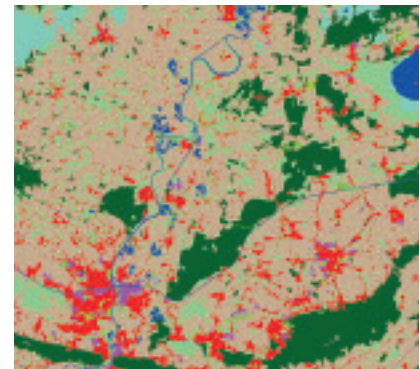
Extracto de mapa de superficie terrestre: cuenca del río Weser (2006)

Muchos de estos productos y servicios, así como también procesos de producción certificados, han sido desarrollados por los expertos de Infoterra durante los proyectos de desarrollo internacional y las actividades previas a la explotación comercial de TerraSAR-X.